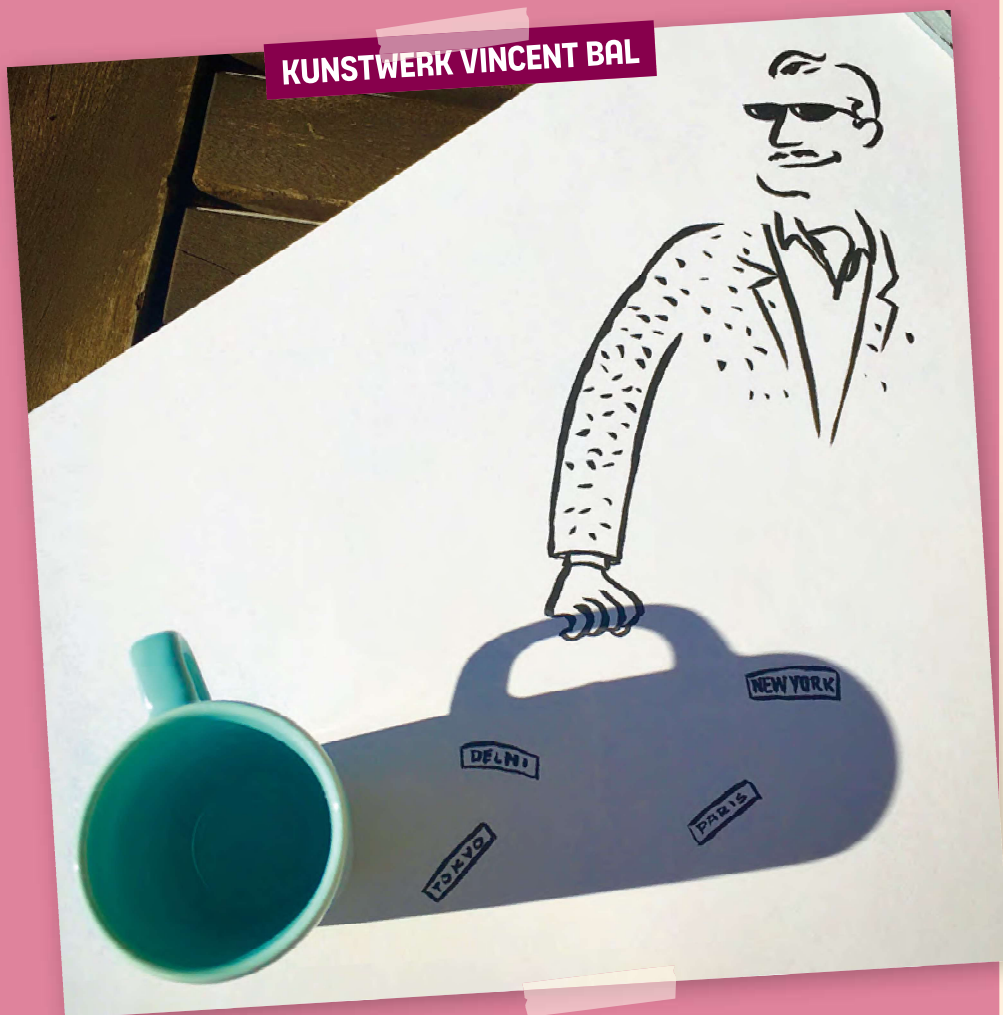
KUNSTWERK VINCENT BAL

De schaduw bracht hem waarschijnlijk op het idee. Hij tekende er een paar zwarte lijntjes bij (niet eens het hele mannetje!) en nu is het een grappig plaatje geworden waar je zo een verhaal bij kunt bedenken.