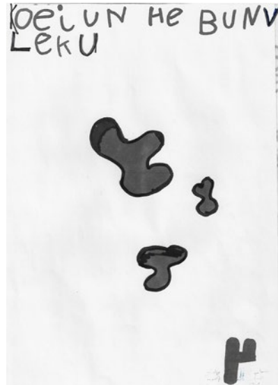
Koeien hebben vlekken