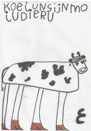
Koeien zijn mooie dieren