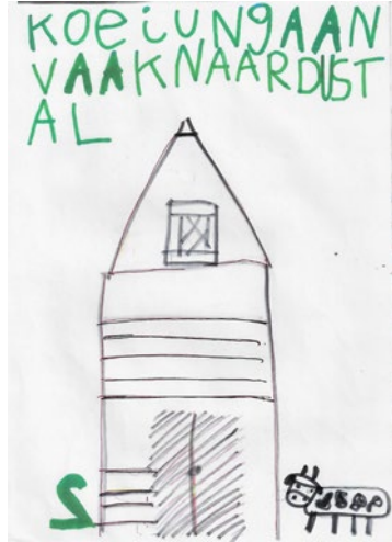
Koeien gaan vaak naar de stal